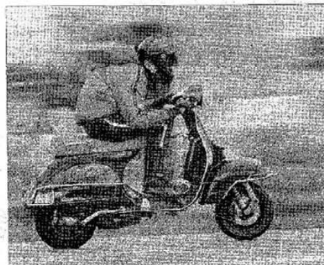
► La Classe 2 est la plus démocratique, car réservée aux moteurs d'origine. Les concurrents y roulent avec leur scooter de tous les jours.