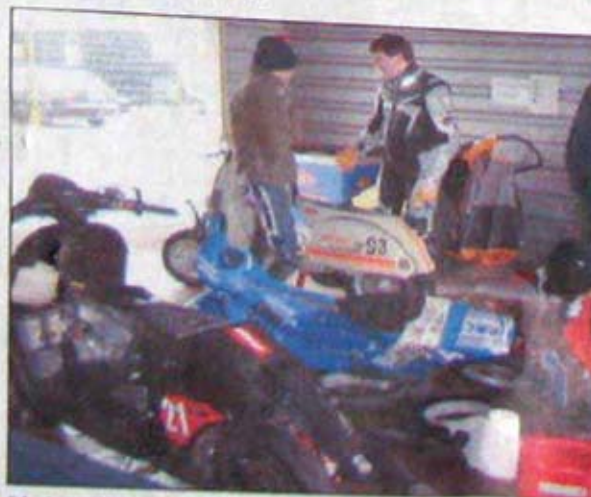
Naturellement, tous les pilotes sont aussi nos.