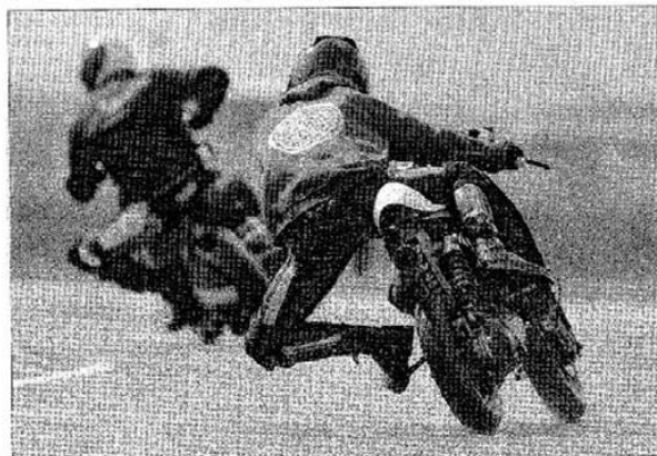
▲ Conçu par terre, malgré la piste encore humide !

Malgré un météo changeante, quelque 75 pilotes français, allemands, italiens, belges, autrichiens (et même un Anglais) sont inscrits et le paddock est plein comme un œuf. Dans la région, c'est tout ou rien : temps sec le vendredi après-midi, temps de chien le samedi matin pour les essais chronométrés, et retour du soleil en début d'après-midi. Deux manches se déroulent sur piste mouillée, une sur piste sèche. En C3 (petites coques préparées) et C4 (grosses coques préparées), royaume des kits Poini et Malossi, les Allemands, plus rapides, opèrent une razzia sur les premières places, mais certains Italiens et Français repartiront avec de beaux accessits. Le clan parisien notamment, constitué de six pilotes, ramène... six coupes, dont quatre sur la seule