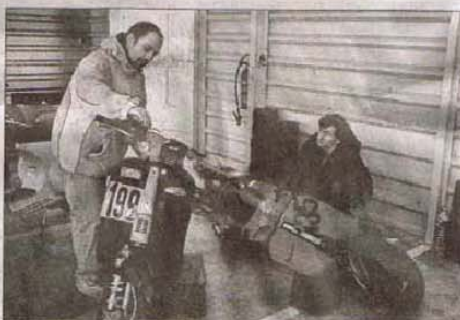
Au stand, on s'active. La pratique du scooter de compétition demande de réelles connaissances en mécanique.

Il vit en Autriche et c'est via le web qu'il a monté l'événement : "J'entends souvent dire qu'internet enferme les gens dans un monde artificiel. C'est totalement faux ! Sans cet outil, nous n'aurions jamais pu organiser «le challenge» . Grâce au web, il est facile de communiquer simultanément avec des personnes basées aux quatre coins du globe pour un coût infime. Les infos vont plus vites. Au niveau de l'organisation, c'est un vrai plus."