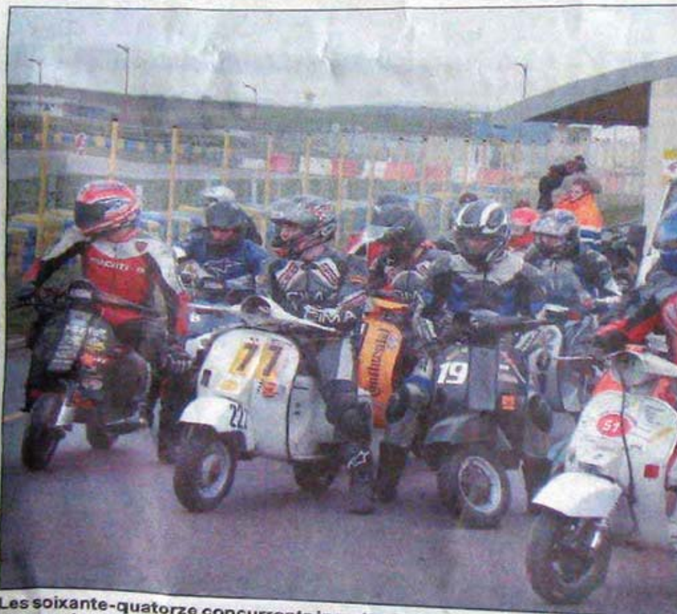
Les soixante-quatorze concurrents inscrits étaient tous des passionnés de vieux scooters regroupés au sein de l'association « Scootentole ».

En dépit d'une conduite souvent rendue délicate par les conditions climatiques, les pilotes se sont réellement fait plaisir sur les 1.250 mètres du circuit. Après quel-