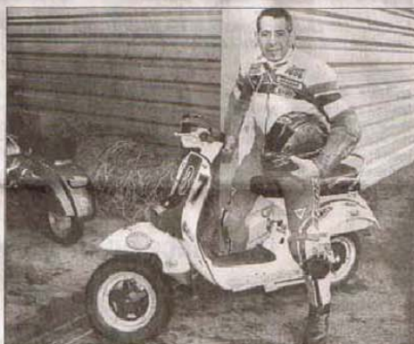
Gepetto a troqué son Lambretta de compétition pour un Vespa. Les réglages ne sont pas encore optimisés.

Quatre-vingt participants venus de toute l'Europe ont participé au 1 er challenge Scootentole. Anglais, Allemands, Italiens, Belges et Français ont rivalisé d'adresse sur un sol à limite du praticable.