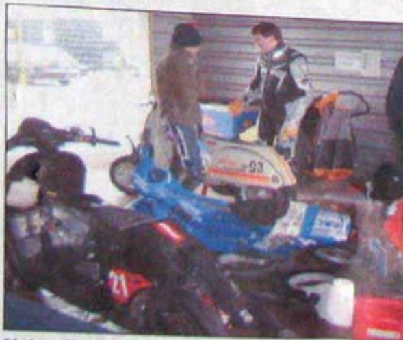
Naturellement, tous les pilotes sont aussi nos.