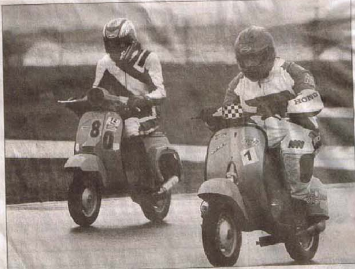
Sensation forte sur bitume détrempé pour les 80 participants du 1 er challenge Scootentole à Juvaincourt.